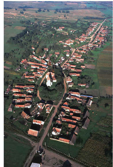
Abbildung 7: Zied