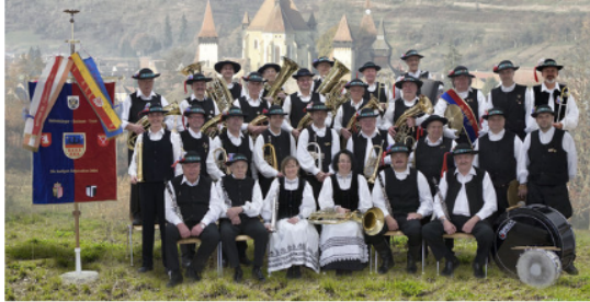
Die Lustigen Adjuvanten, 2014