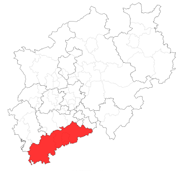
Abbildung 4: NRW mit KG Bonn