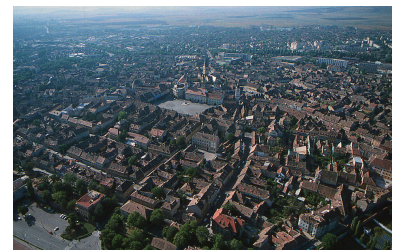
Abbildung 8: Hermannstadt

2 Universalgenies und Westmänner vom Schlege eines Winnetou oder Old Shatterhand mal ausgenommen 😊